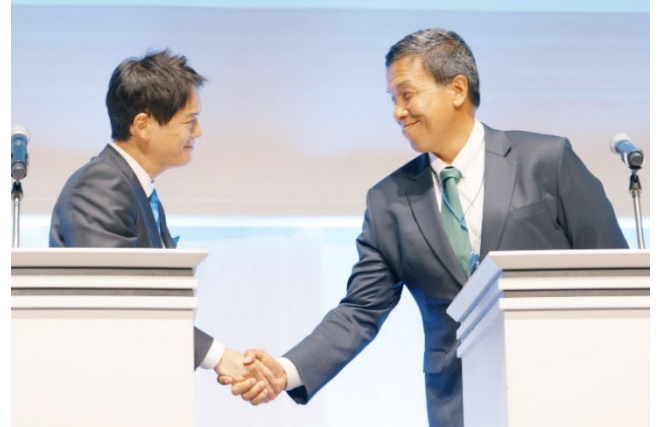
第12回 ASCC での横浜市長とバンコク都知事の共同宣言

など、横浜市とバンコク都との都市間連携は、アジアにおいて脱炭素に取り組む都市の拡大の動きにつながっています。