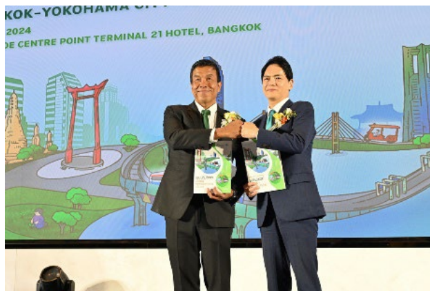
バンコク都エネルギー・アクションプランの発表

今後、同プランのGHG排出削減目標の達成に向けて、民間技術の導入が促進されることが期待されます。