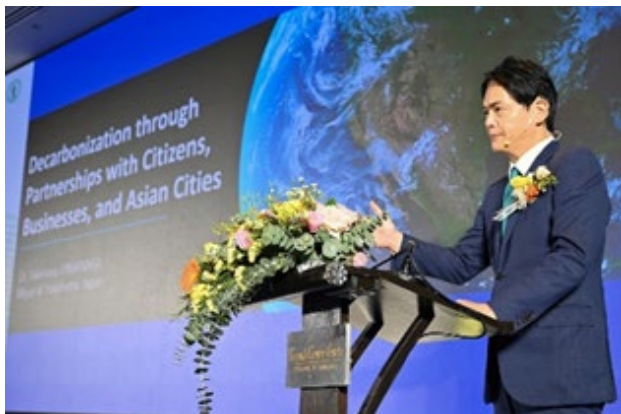
横浜市長による基調講演

2024年6月21日、横浜市、バンコク都、日本国環境省、一般社団法人海外環境協力センター（OECC）の共催により、両国のビジネスセクターを交えた「横浜・バンコク 脱炭素都市間連携ワークショップ」を開催し、基調講演として、横浜市の脱炭素分野の取組を紹介しました。