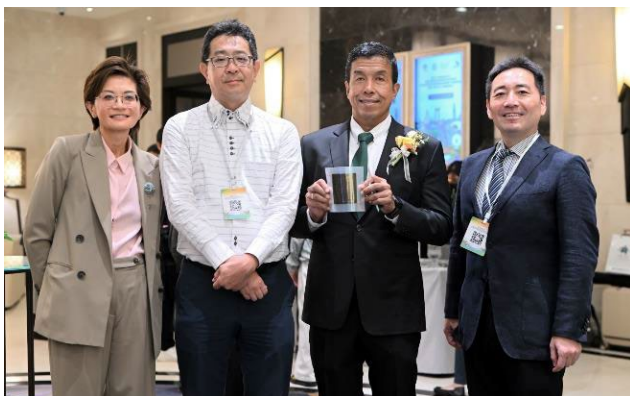
横浜・バンコク 脱炭素都市間連携ワークショップにて（マクニカ・セナ社、バンコク都知事とともに撮影）

横浜市は、これまでもバンコク都との都市間協力事業としてビジネスマッチングの機会を設け、企業間の交流を積極的に後押ししてきました。両社はこうした、横浜市とバンコク都との都市間連携を基にしたビジネスマッチング機会を活用して結びつきを深め、今回の発表につながりました。