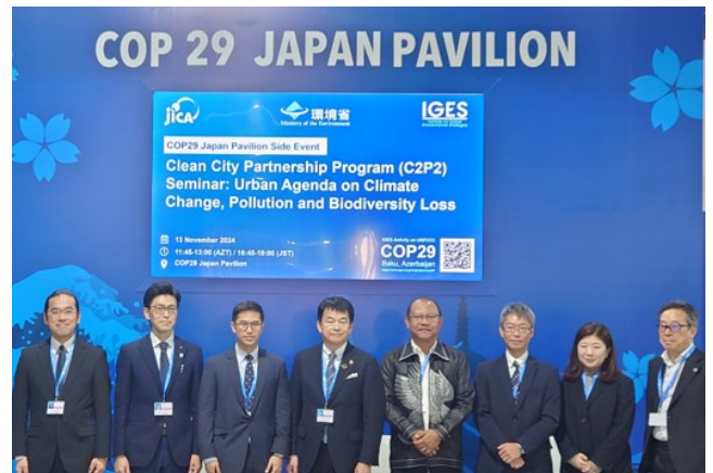
COP29 ジャパンパビリオンでのセミナー登壇

本稿でご紹介した取組も含め、長年にわたる両都市の連携が環境省から評価され、11月に開催された国連気候変動枠組条約第29回締約国会議（COP29）のジャパンパビリオンにて、環境省主催の「クリーン・シティ・パートナーシップ・プログラムセミナー」にバンコク都と共に登壇しました。