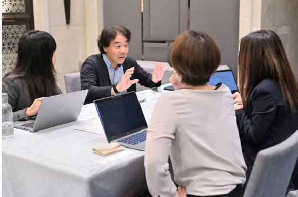
参加企業の面談の様子

バンコク都内で行われた同ワークショップには、日本とタイから、現地会場 170 名、オンライン 90 名の参加があり、ワークショップの一環で実施したビジネスマッチングには、日本とタイから 12 社が参加し、日・タイ間の活発なビジネス交流が見られました。