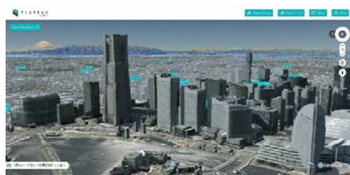
PLATEAU VIEW による みなとみらい