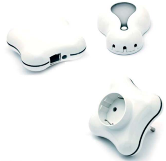
家庭用機器(トランスミッター、コンセント等)