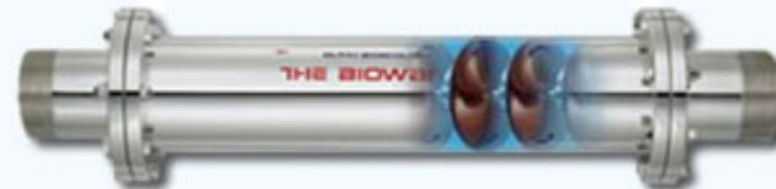
バイオウォーター